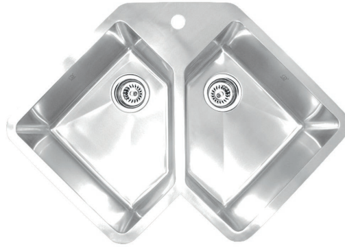
STAINLESS STEEL GBD347