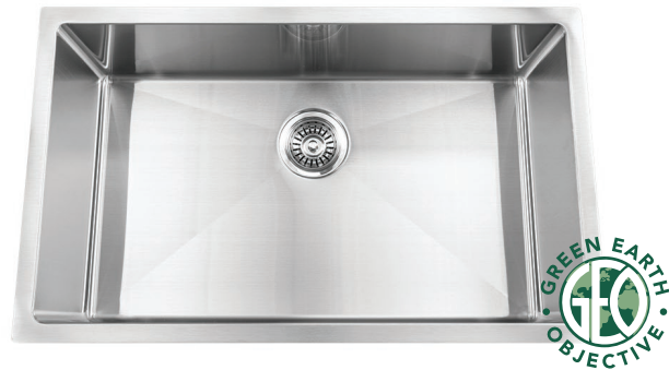
STAINLESS STEEL GGSRR3018