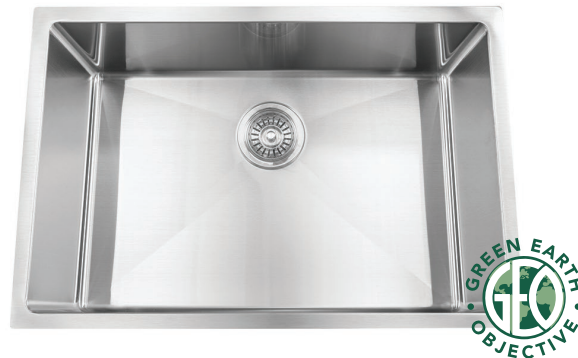
STAINLESS STEEL GGSRR2718