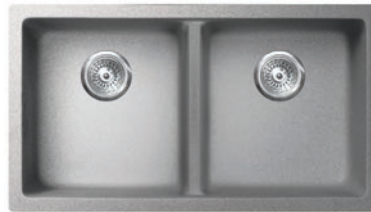
SMOKE GREY GVD3215A-SG