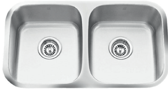
STAINLESS STEEL GQD519