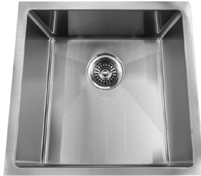
STAINLESS STEEL GQS1917