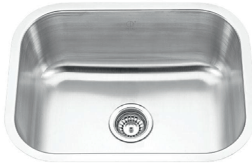
STAINLESS STEEL GBS623