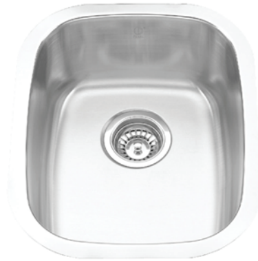
STAINLESS STEEL GBS915