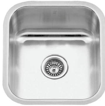
STAINLESS STEEL GBS917