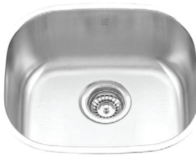
STAINLESS STEEL GBS912